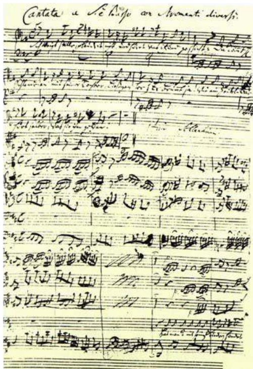
← Rukopis Bachovy Kávové kantáty.