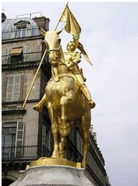
← Socha Jany z Arku na Places des Pyramides v Paříži (A. Honegger – oratorium Jana z Arku na hranici ).