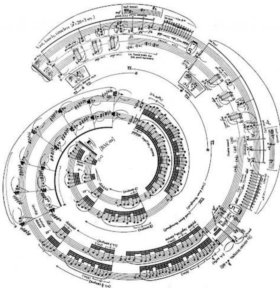
← Ukázka grafické partitury.