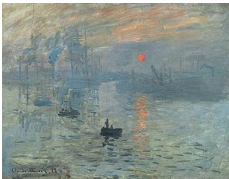
← Imprese, východ slunce, Claude Monet.