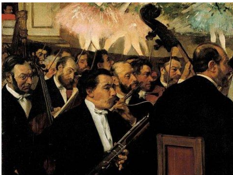
← Ukázka romantického orchestru.