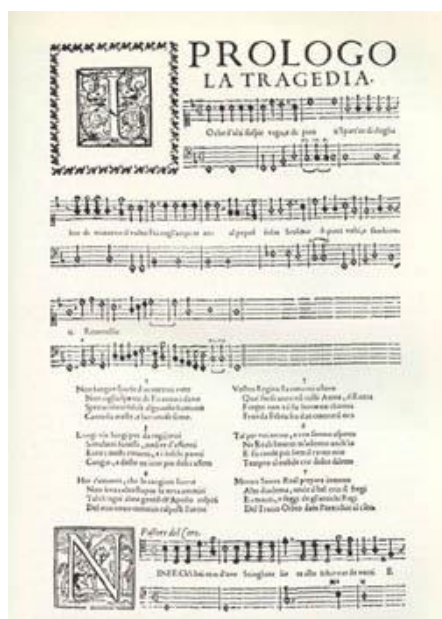
Prolog k opeře Euridice Jacopa Periho. →