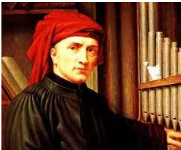
← Josquin Des Prez.