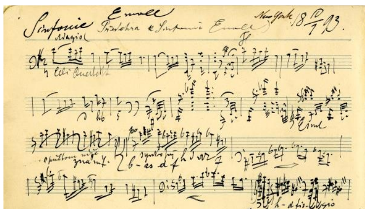
← První věta ze Symfonie č. 9 Antonína Dvořáka.