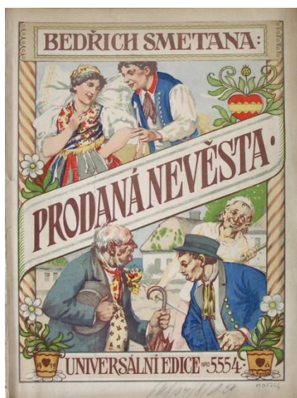
← Plakát k inscenaci opery Prodaná nevěsta Bedřicha Smetany z roku 1919.