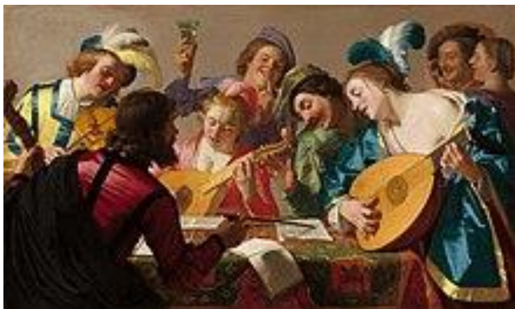
← Hudebníci kolem roku 1600.