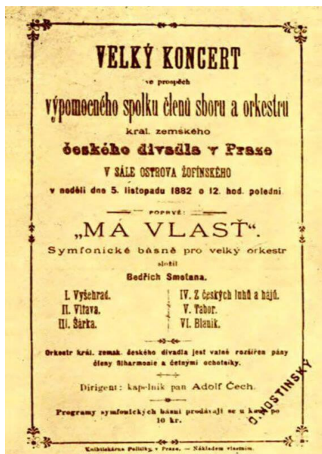
← Plakát k prvnímu provedení Mé vlasti .