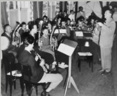
„Velký úspěch m i ve školním roce 1961/1962 nově vybudovaný žakovský dechový orchestr, který idil u . Melichar Bo ek...“ (z kroniky školy, 1962)

Od roku 1986 spolupracuje naše škola z pov ení MŠMT na výuce RVHV p i základních školách realizujících tento projekt v naší spádové oblasti. Rozší ená výuka hudební výchovy probíhala postupn v ZŠ Kuldova, v ZŠ Vranovská, v ZŠ Merhautova. Od roku 2000 se podílíme nástrojovou výukou hudebního oboru na RVHV v ZŠ Krásného.