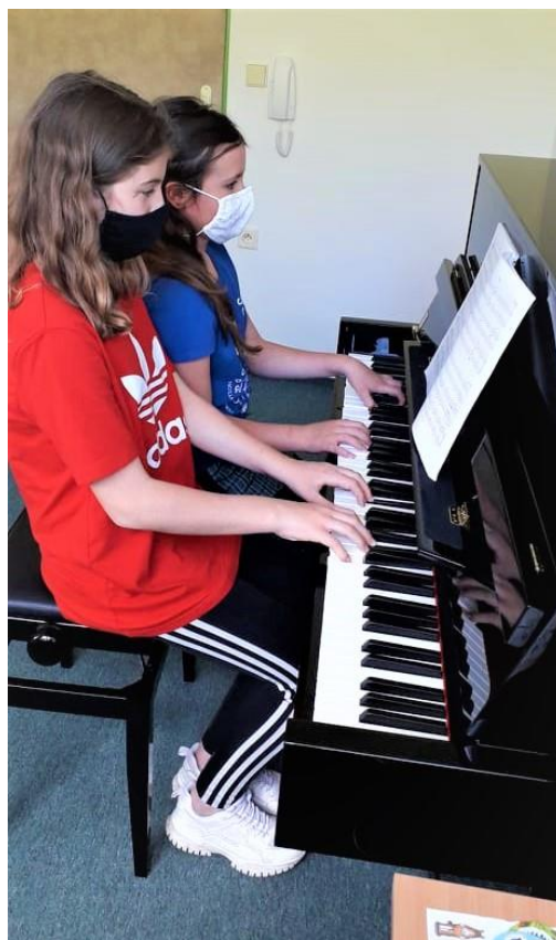
◀ Po 11. květnu 2020 mohli pedagogové konečně částečně vypnout své počítače i chytré telefony a pustit se opět naplno do plnohodnotného uměleckého rozvoje svých mladých svěřenců, který byl nově obohacen o poznatky a dovednosti z období distančního vzdělávání. Text i foto Mgr. Marcela Hamrová Hoňková