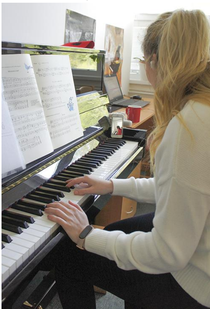
květen 2020.

11. května 2020 byla znovu zahájena prezenční výuka v budovách ZUŠ. Přestože nouzový stav skončil, některé žáky nechali jejich rodiče doma, takže nadále pokračovali v distanční výuce. Běžně tak v závěru školního roku učitelé vyučovali větší část úvazku prezenčně a souběžně několik žáků distančně. Obrázek dokumentuje každodenní situaci: pedagog u nástroje v učebně se sluchátky na uších, notebook nebo chytrý telefon s komunikačním softwarem (Skype nebo aplikace Messenger, WhatsApp) a u nástroje doma on-line vyučovaná žákyně nebo žák.