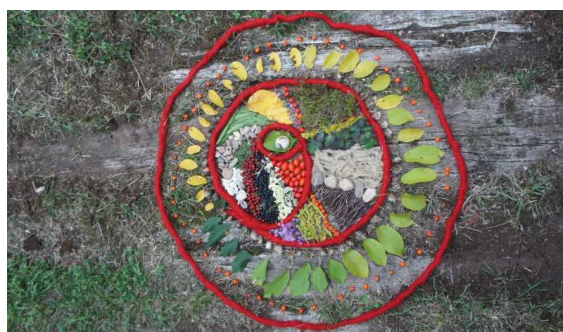
▲ Land art v areálu zahrady školy v podání žáků výtvarného ateliéru Dagmar Bočkové. Foto Dagmar Bočková.