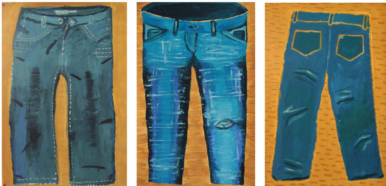
▲ Malby na téma: „Ikonické rifle“.

Výstava navazovala na techniku modrotisku. Byla inspirována indigovou modří, používanou jako barvivo na oblečení z rifloviny. Původně pracovní oděvy z tohoto materiálu se v minulém století staly běžnou součástí našich šatníků a zároveň velmi módní i prestižní záležitostí. Zevrubnější průzkum tohoto fenoménu se stal předmětem práce žáků výtvarného oboru ve studijní kresbě, v malbě ikonických riflí i v abstraktní malbě. Další plánovanou část: tvarování, formování a spojování částí rifloviny s jinými vybranými materiály do nových objektů přerušilo uzavření školy.