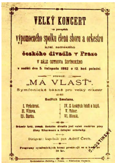
← Plakát k prvnímu provedení Mé vlasti