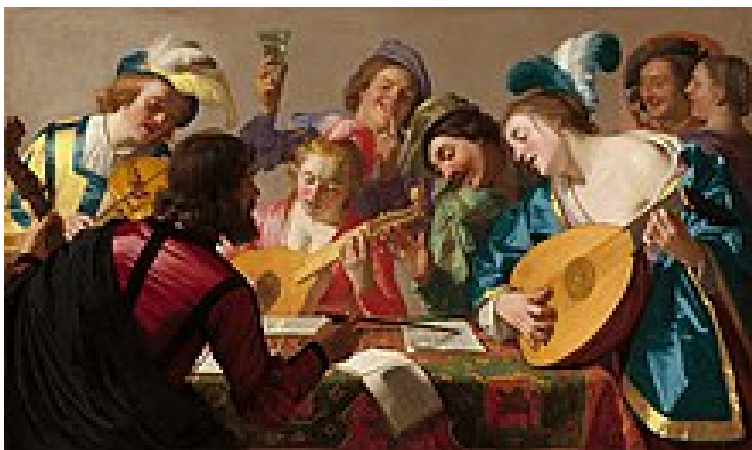
← hudebníci kolem roku 1600