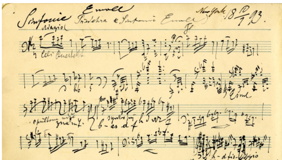
← První věta ze Symfonie č. 9 Antonína Dvořáka.