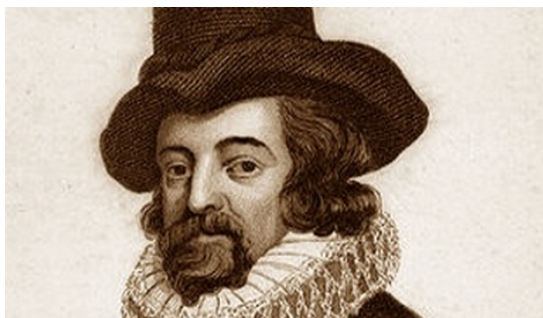
← Jacopo Peri