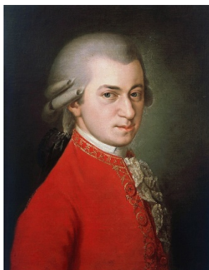
Wolfgang Amadeus Mozart