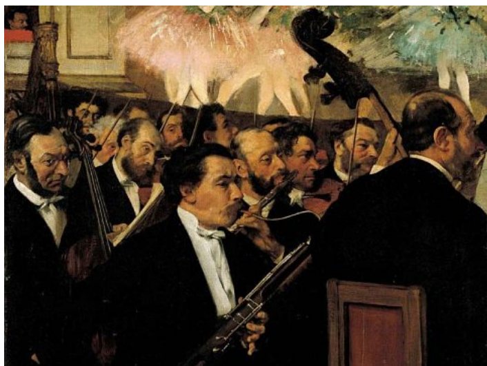
← ukázka romantického orchestru